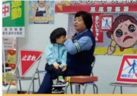
9月23日 交通安全フェスタ 2014 秋

八王子市では8月に立続けに自転車の交通死亡事故が発生。秋の全国交通安全運動で地域の皆様、観光客の方に交通事故防止対策を呼び掛けしました。