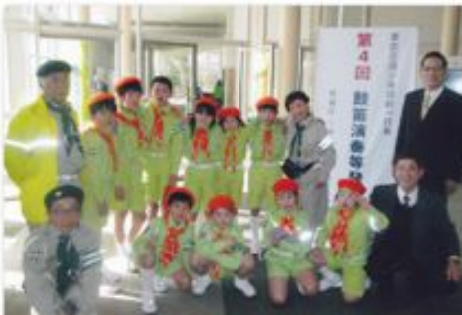
1月25日 東京交通少年団統一鼓笛演奏発表会

国立オリンピック青少年センターにて「東京交通少年団 第4回 統一鼓笛演奏発表会」がありました。