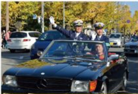
11月15、16日 いちよう祭り

地元のアルプス運送有限会社のご協力のもとトラック2台を運んでいただき、園児達が実際に運転席に座り、「死角」があることを体験してもらいました。