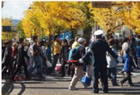
富士森高校のボランティア部と高尾交通少年団も応援！

両日とも晴天に恵まれ、多くの市民や観光客が散策をされました。多摩御陵入口交差点の南側に本部を設置し、多摩御陵入口を挟んだ東西の主要交差点、多摩御陵参道の南北の交差点に高尾安全協会の指導員が配置されました。