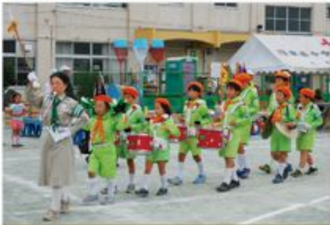
10月12日 高尾交通少年団 In 浅川小学校

「浅川地区市民大運動会」に高尾交通少年団が招待され、鼓笛隊演奏をしながらグラウンドを1周しました。