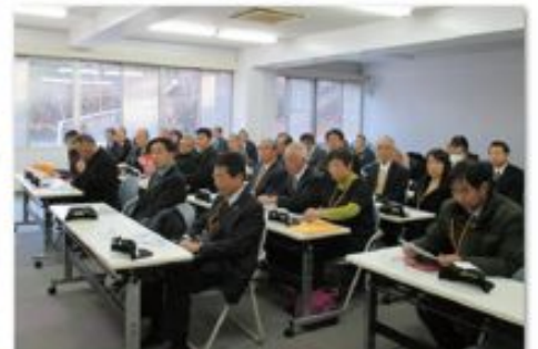
2月10日 第九方面安全運転管理者部会

国立オリンピック青少年センターにて「東京交通少年団 第4回 統一鼓笛演奏発表会」がありました。