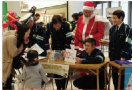
12月6日 TOKYO 交通安全キャンペーン

「浅川地区市民大運動会」に高尾交通少年団が招待され、鼓笛隊演奏をしながらグラウンドを1周しました。